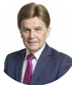
Mauri Pekkarinen Valiokunnan jäsen, ITRE, Renew Europe