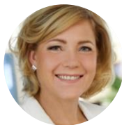
Henna Virkkunen Valiokunnan jäsen, ITRE, EPP