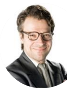
Ville Niinistö Ryhmävastaava, MEP, ITRE